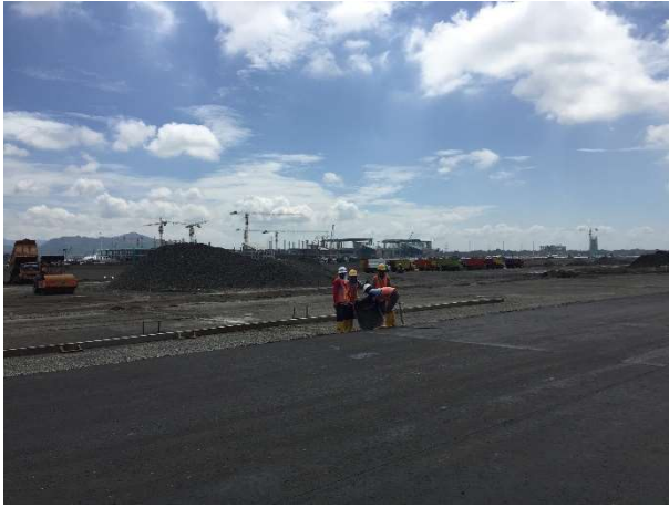
Proses pengaspalan lapis kedua Runway