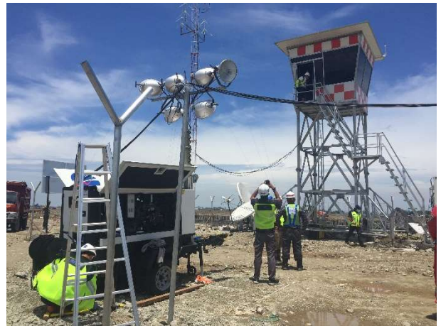
Modular Tower sudah terinstalasi