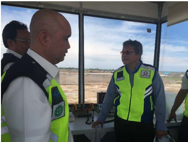
Ruang Pelayanan Navigasi Penerbangan