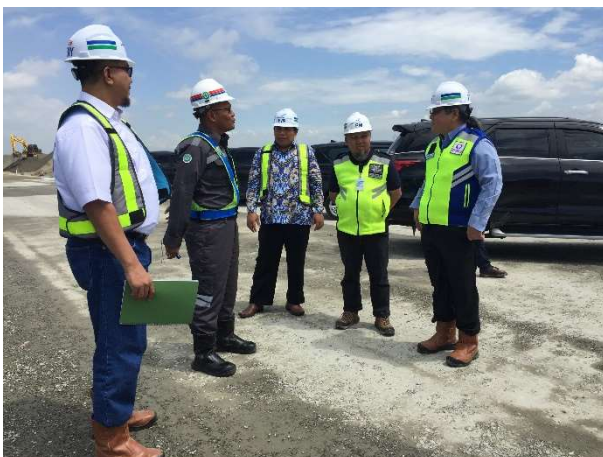
Satker menjelaskan progres pembangunan kepada Ombudsman RI