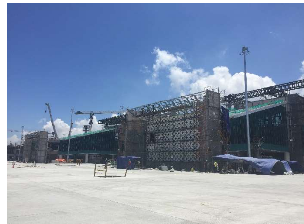
Terminal Penumpang (sisi airside)