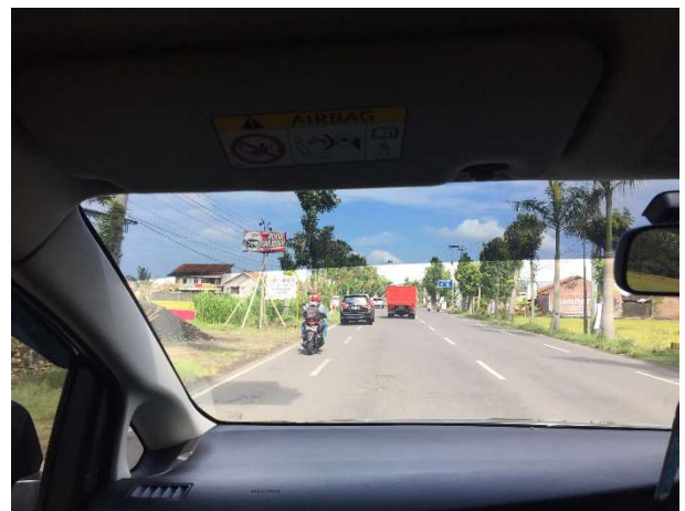
Akses jalan menuju BUBY (Jalan Wates – Purworejo)