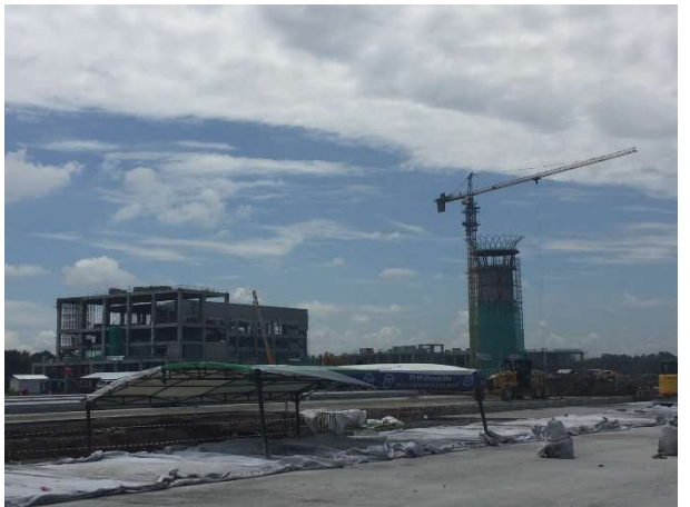
Tower Navigasi setinggi 8 lantai sedang proses pembangunan