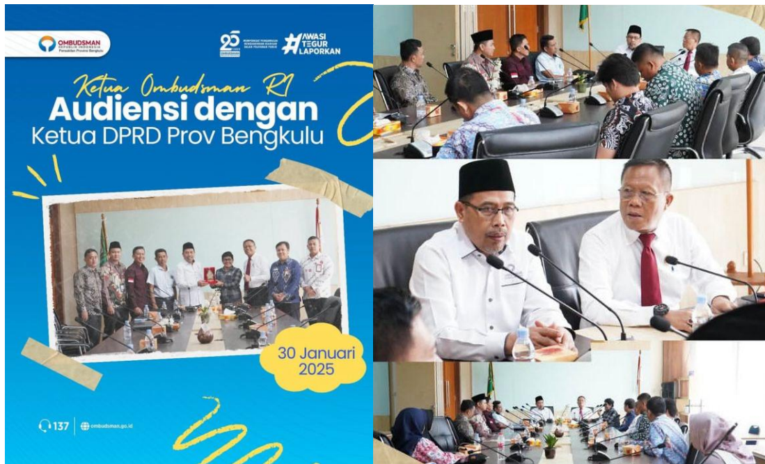
Ketua Ombudsman RI Audiensi dengan Ketua DPRD Provinsi Bengkulu - 30 Januari 2025