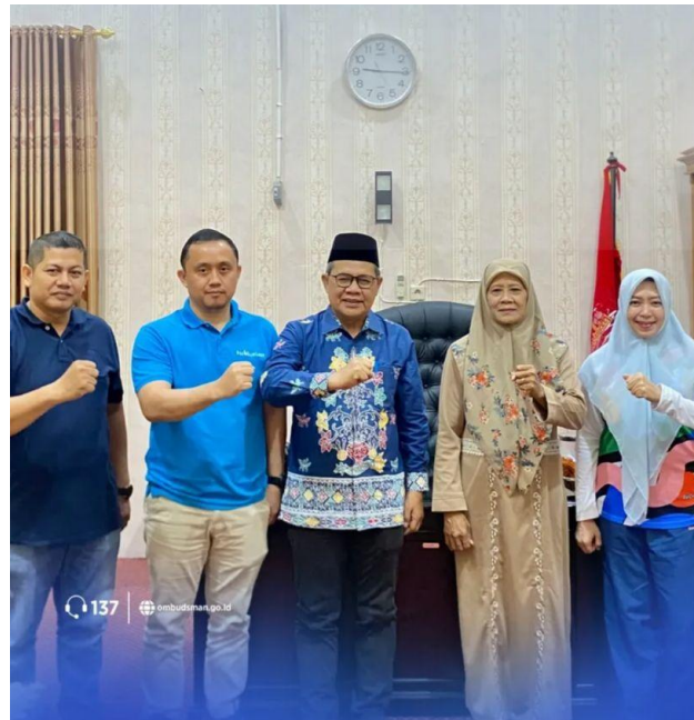
Koordinasi Acara Kegiatan Penandatanganan MOA dan Kuliah Umum Oleh Ketua Ombudsman RI Bersama Rektor Uinfas Bengkulu - 30 November 2025