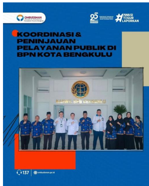
Koordinasi dan Peninjauan Pelayanan Publik di BPN Kota Bengkulu - 17 Februari 2025