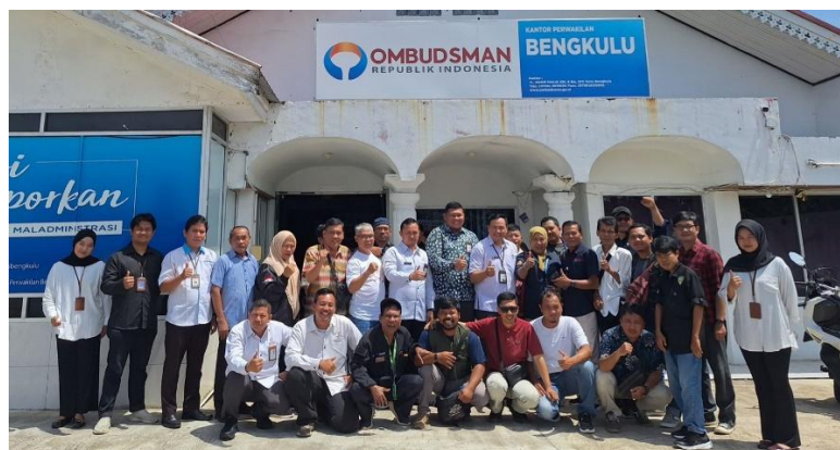
Evaluasi Pelayanan Publik Ombudsman RI Perwakilan Provinsi Bengkulu Menutup Akhir Tahun 2025 Dengan Menyampaikan Catatan Akhir Tahun Pengawasan Pelayanan Publik. - 22 Desember 2025