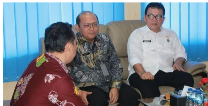
Audiensi Bersama KA Kanwil Kemenham Sumatera Selatan dan Ombudsman RI Provinsi Bengkulu Demi Tingkatkan Pelayanan Publik HAM - 7 Agustus 2025