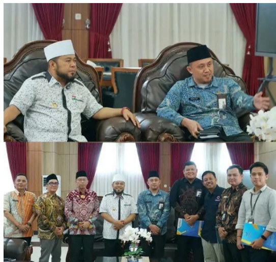
Koordinasi Kepala Perwakilan Ombudsman Bengkulu Dengan Gubernur Bengkulu Terkait Isu Terkini Pelayanan Publik - 30 Juni 2025