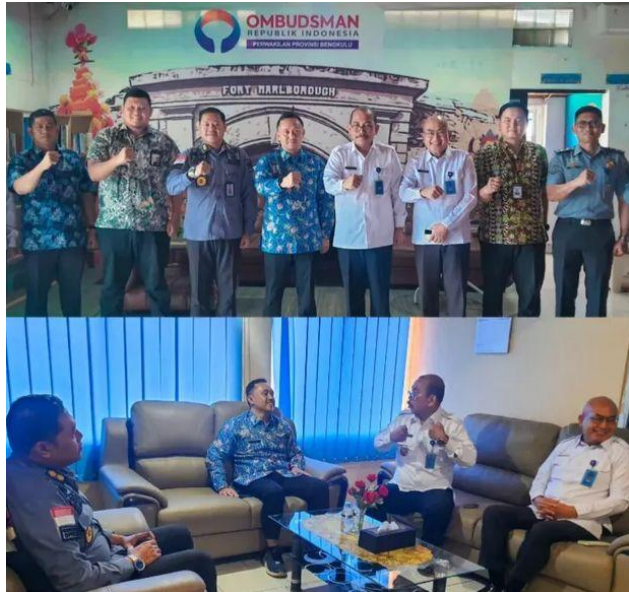
Perkuat Kerjasama Ombudsman dan Kanwil Ditjen Imigrasi Bengkulu Dalam Pengawasan Pelayanan Publik - 4 Maret 2025