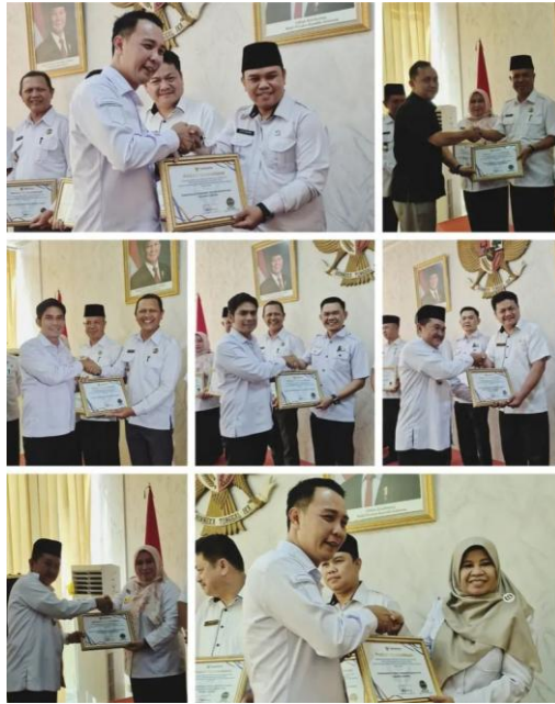
Opini Pengawasan Penyelenggaraan Pelayanan Publik “Penganugerahan Piagam Penghargaan Kepatuhan Penyelenggaraan Publik Tahun 2024” - 2 Mei 2025