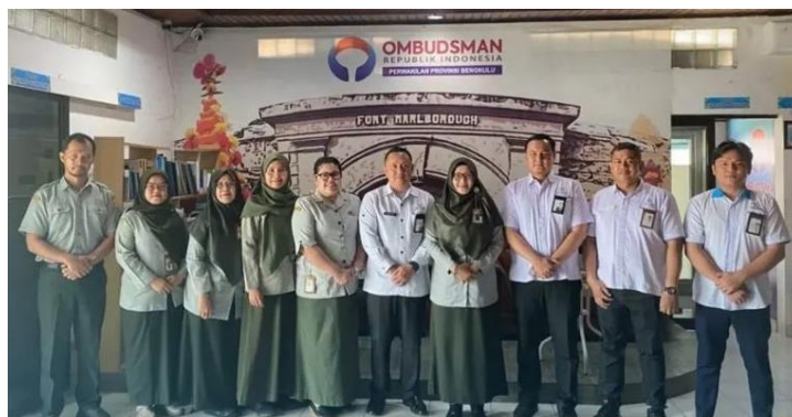
Koordinasi Acara Kegiatan Penandatanganan MOA dan Kuliah Umum Oleh Ketua Ombudsman RI Bersama Rektor Uinfas Bengkulu - 30 November 2025