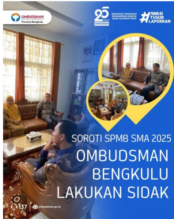
Ombudsman RI Perwakilan Provinsi Bengkulu Melakukan Inspeksi Mendadak ke Sejumlah Sekolah Tingkat SMA Dalam Rangka Pengawasan Seleksi Penerimaan Murid Baru 2025 - 10 Juli 2025