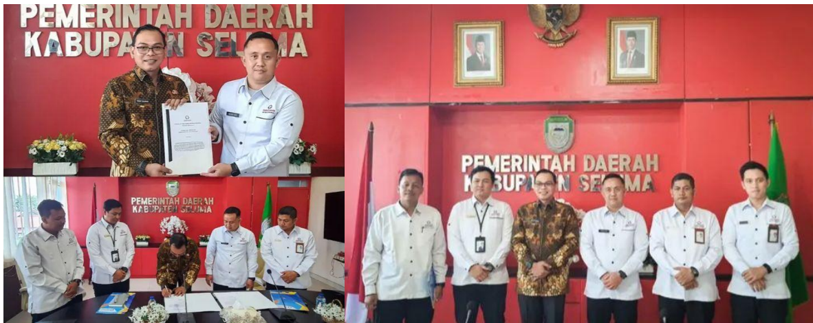
Penandatanganan BA Penyerahan Laporan Hasil Pemeriksaan (LHP) Substansi Kepegawaian di Pemerintahan Kabupaten Seluma - 11 April 2025