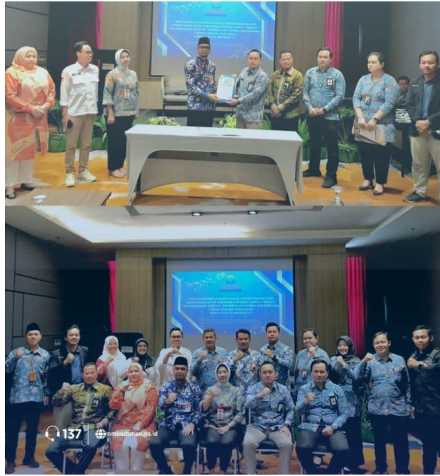
Ombudsman RI Perwakilan Provinsi Bengkulu Menyampaikan LHP Investigasi IAPS Terkait SPMB SMAN 5 Kota Bengkulu - 19 September 2025