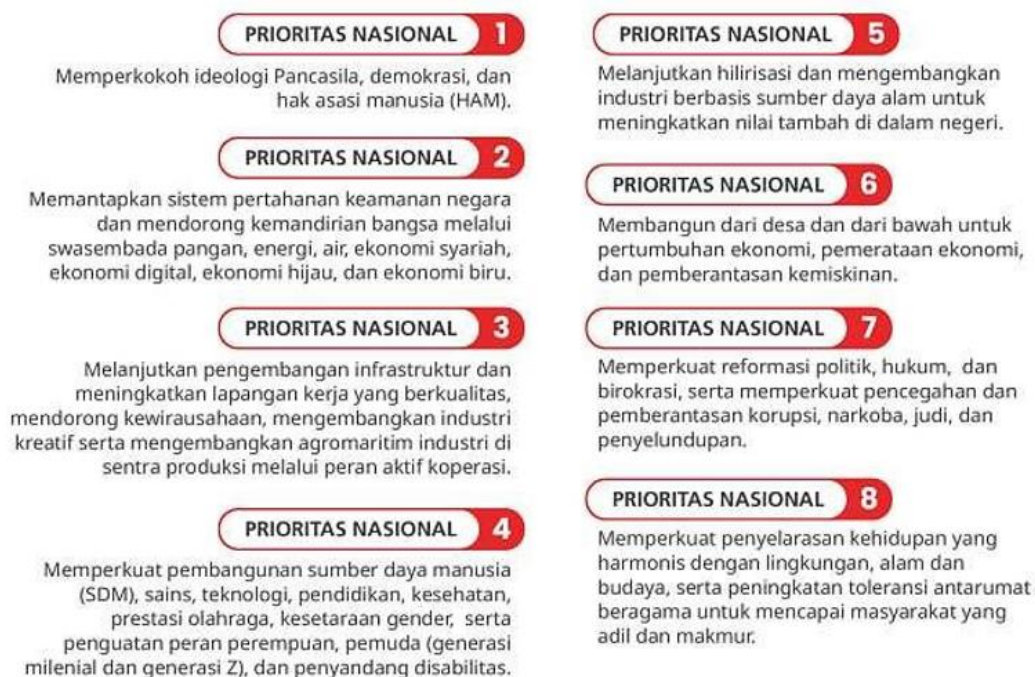
Gambar 2. Prioritas Nasional RPJMN Tahun 2025-2029

Bahwa RO (Rencana Output) jumlah laporan/ pengaduan masyarakat yang diselesaikan Ombudsman RI Pusat termasuk dalam Program Prioritas “Transformasi tata kelola pelayanan publik dan pembangunan”. Adapun Program Prioritas tersebut merupakan turunan dari Prioritas Nasional Angka 7 “Memperkuat reformasi politik, hukum, dan birokrasi, serta memperkuat pencegahan dan pemberantasan korupsi, narkoba, judi, dan penyelundupan”.