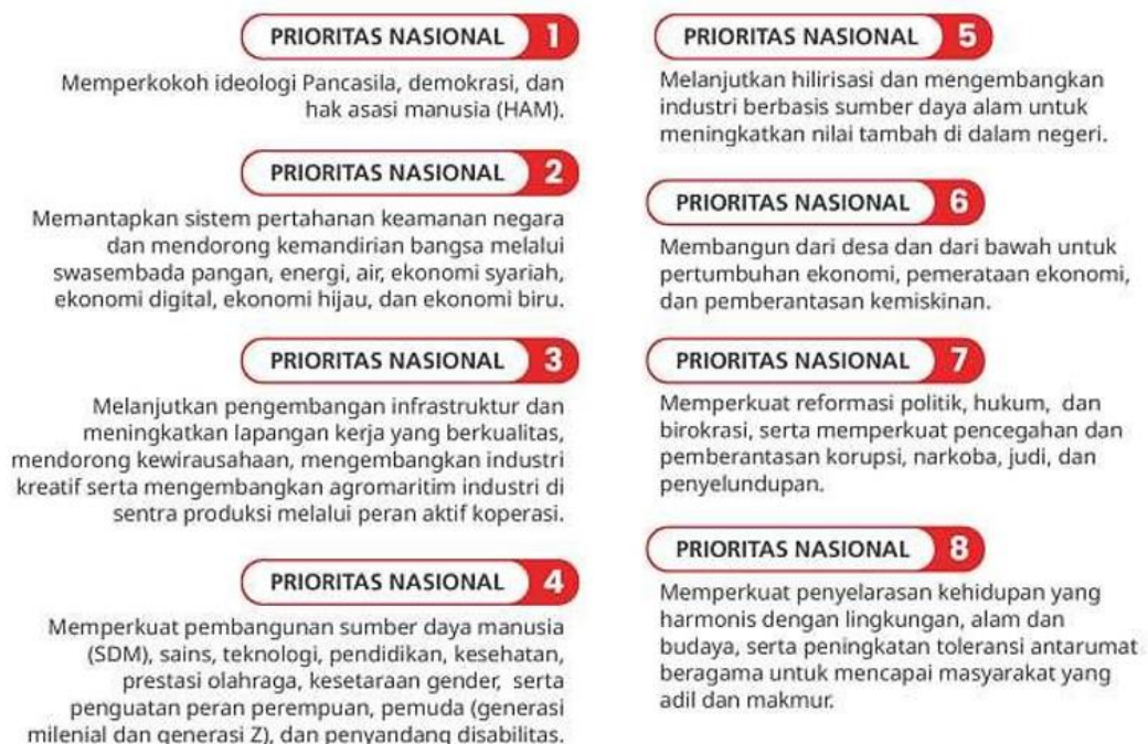
Gambar 3. Prioritas Nasional RPJMN Tahun 2025-2029

Sumber: Peraturan Presiden Nomor 12 Tahun 2025 tentang Rencana Pembangunan Jangka Menengah Nasional Tahun 2025-2029